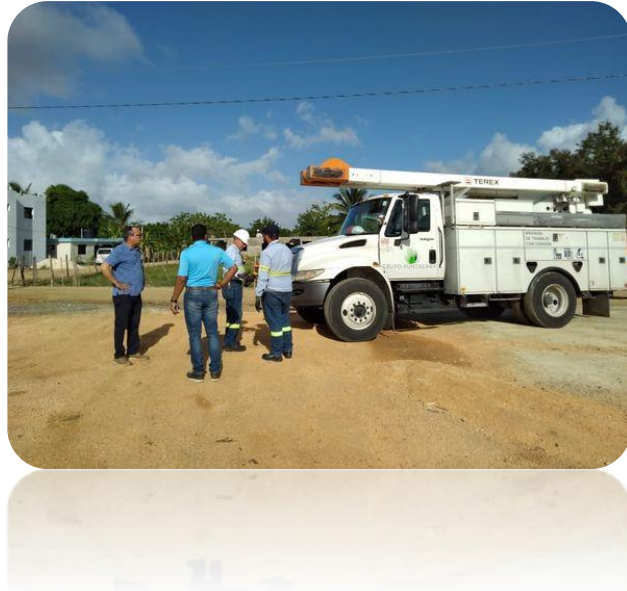
Arreglo de los dougaut del play